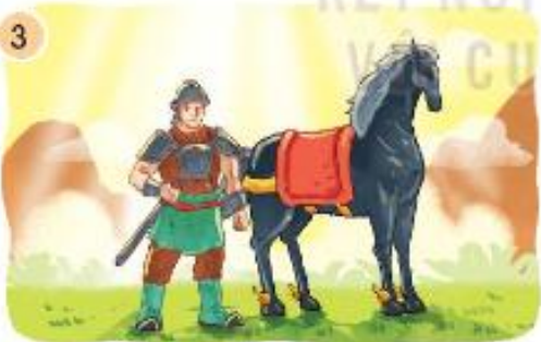
Gióng đã thay đổi như thế nào?