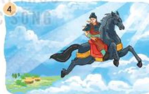
Sau khi đánh đuổi giặc Ân, Gióng đã làm gì?