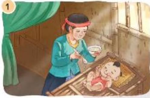
Cậu bé Gióng có gì đặc biệt?