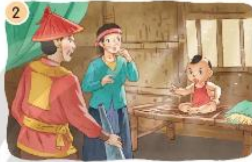
Gióng đã nói gì với sù giả?